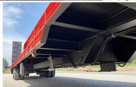
Surface utile : 11m70 x 2m54, Tourelle, RC 235/75 R17.5 Jum., Carré 20 sur plateforme, Cale-Roue...