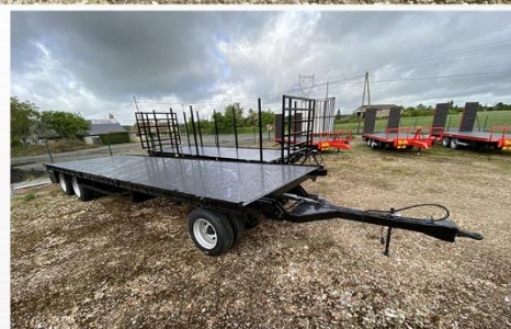
Surface utile : 9m00 x 2m54, Tourelle, RJ 215/75 R17.5, Echelle av/arr avec rallonge, Rampes Aluminium...

Sarl BCM - D910 La Normandie - 37110 VILLEDOMER - 02.47.550.100 - www.remorques-bcm.com