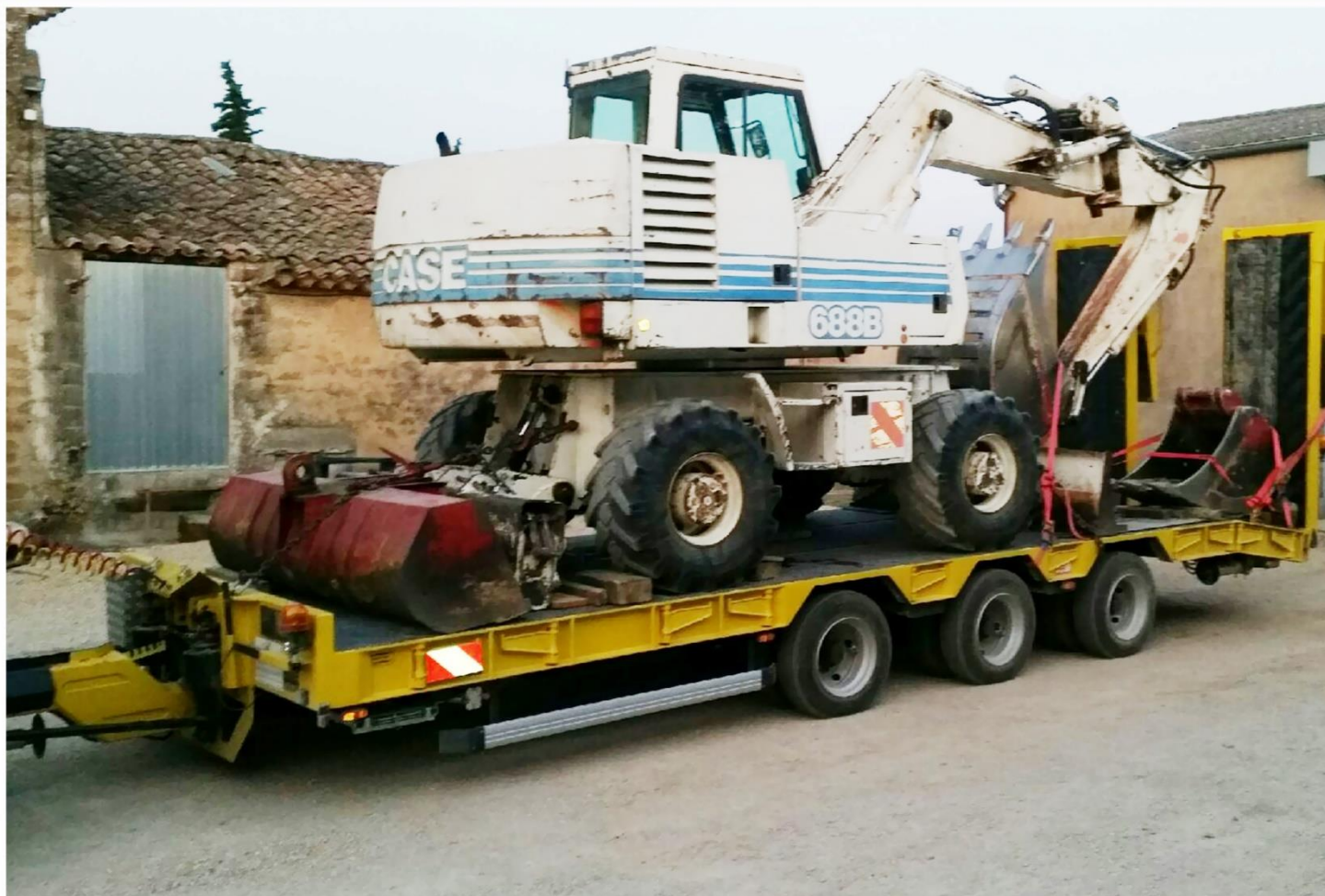
Exemples de chargement