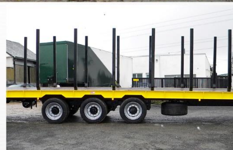
Dim. : 11m60 x 2m54, Tridem, Freinage mixte 25Km/h, Suiv. ar, RC 445/65 R22.5 + RS, Ranchers lat., Grille avant...

Sarl BCM - D910 La Normandie - 37110 VILLEDOMER - 02.47.550.100 - www.remorques-bcm.com