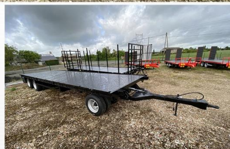
Surface utile : 9m00 x 2m54, Tourelle, RJ 215/75 R17.5, Echelle av/arr avec rallonge, Rampes Aluminium...