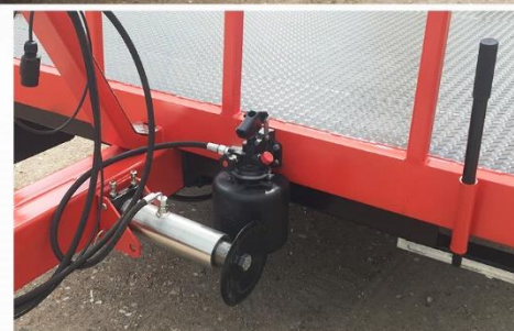
Dim. : 5m00 x 2m54, Rampes plancher Bois Guide Chenille, Béquille latérale & Pompe à main, Fer plat sur rive...