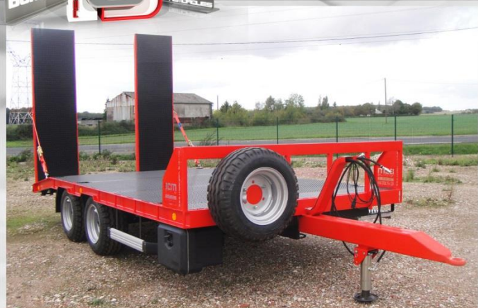
Surface utile : 5m00 x 2m54, Essieux fixes, RC 13.0-55 /17, Roue de secours & support

PORTE-ENGINES 9 PIC PORTE-ENGINES 11 PIC PORTE-ENGINES 1315 PIC