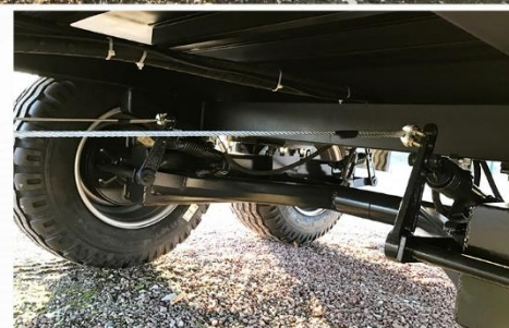
Dim. : 5m00 x 2m30, Balancier, RC 15.0-55 R17, Anneau à boulonner & réglable, Rampes doubles, Pompe à main...