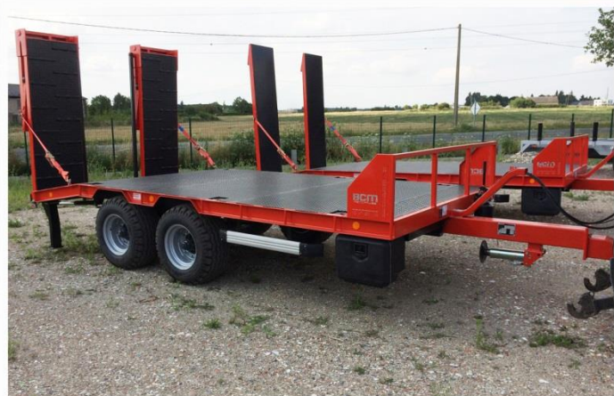
Surface utile : 5m00 x 2m54, Balancier, RC 15.0-55 /17, Rampes doubles et plancher fer + carré 20*20