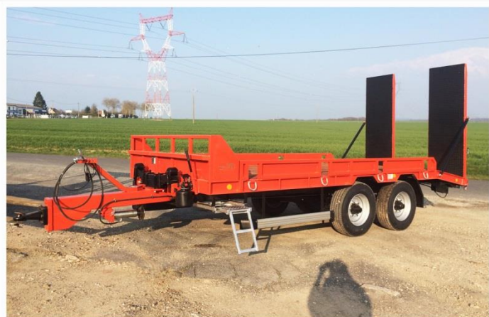
Surface utile : 5m50 x 2m54, Balancier, RC 235/75 R17.5 GoodYear, Anneau à boulonner réglable ...