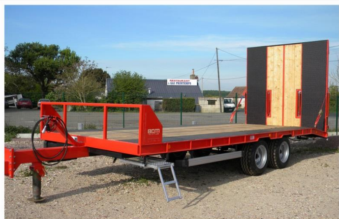
Surface utile : 6m60 x 2m54, RC 13.0-55 /17, Flèche réglable, Plate-forme mixte, Rampe largeur totale