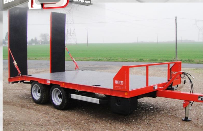
Surface utile : 5m00 x 2m54, Essieux fixes, RC 13.0-55 /17, Anneaux d'arrimages encastrés

PORTE-ENGINES 9 PIC PORTE-ENGINES 11 PIC PORTE-ENGINES 13/5 PIC