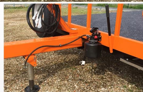
Dim. : 5m00 x 2m54, RC 215/75 R17.5 + Roue de secours & support, Plancher Rampes carré 20, Pompe à main...

Sarl BCM - D910 La Normandie - 37110 VILLEDOMER - 02.47.550.100 - www.remorques-bcm.com