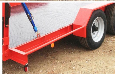
Surface utile : 5m00 x 2m04, Essieux fixes, RC 215/75 R17.5, Rampes & Béquilles arrières manuelles