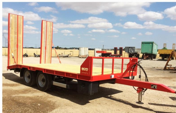
Surface utile : 5m00 x 2m54, Essieux fixes, RC 215/75 R17.5, Plate-forme Bois sapin