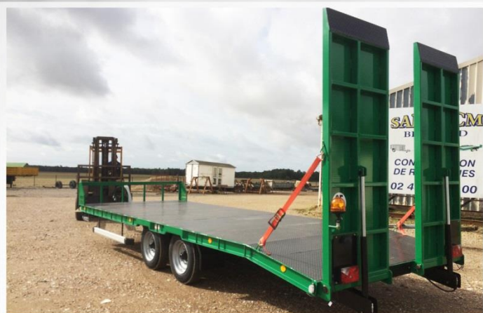
Surface utile : 7m00 x 2m54, Essieux fixes, RC 215/75 R17.5, Rampes larges (0m90)