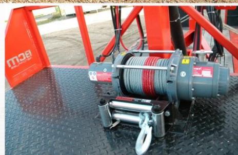
Surface utile : 5m00 x 2m04, RC 215/75 R17.5, Plateau Basculant hydraulique, Treuil électrique 7T

Sarl BCM - D910 La Normandie - 37110 VILLEDOMER - 02.47.550.100 - www.remorques-bcm.com