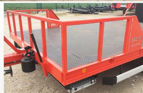
Dim. : 5m00 x 2m54, RC 13.0-55 R16, Retour grille avant (espace godets), Pompe à main...

Sarl BCM - D910 La Normandie - 37110 VILLEDOMER - 02.47.550.100 - www.remorques-bcm.com