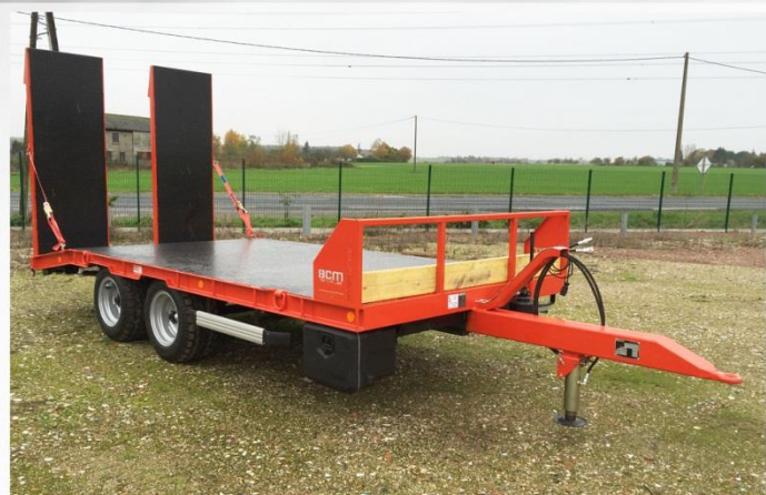
Surface utile : 5m00 x 2m30, Essieux fixes, RC 13.0-55 /16, Rampes larges (0m80), Bastaing avant